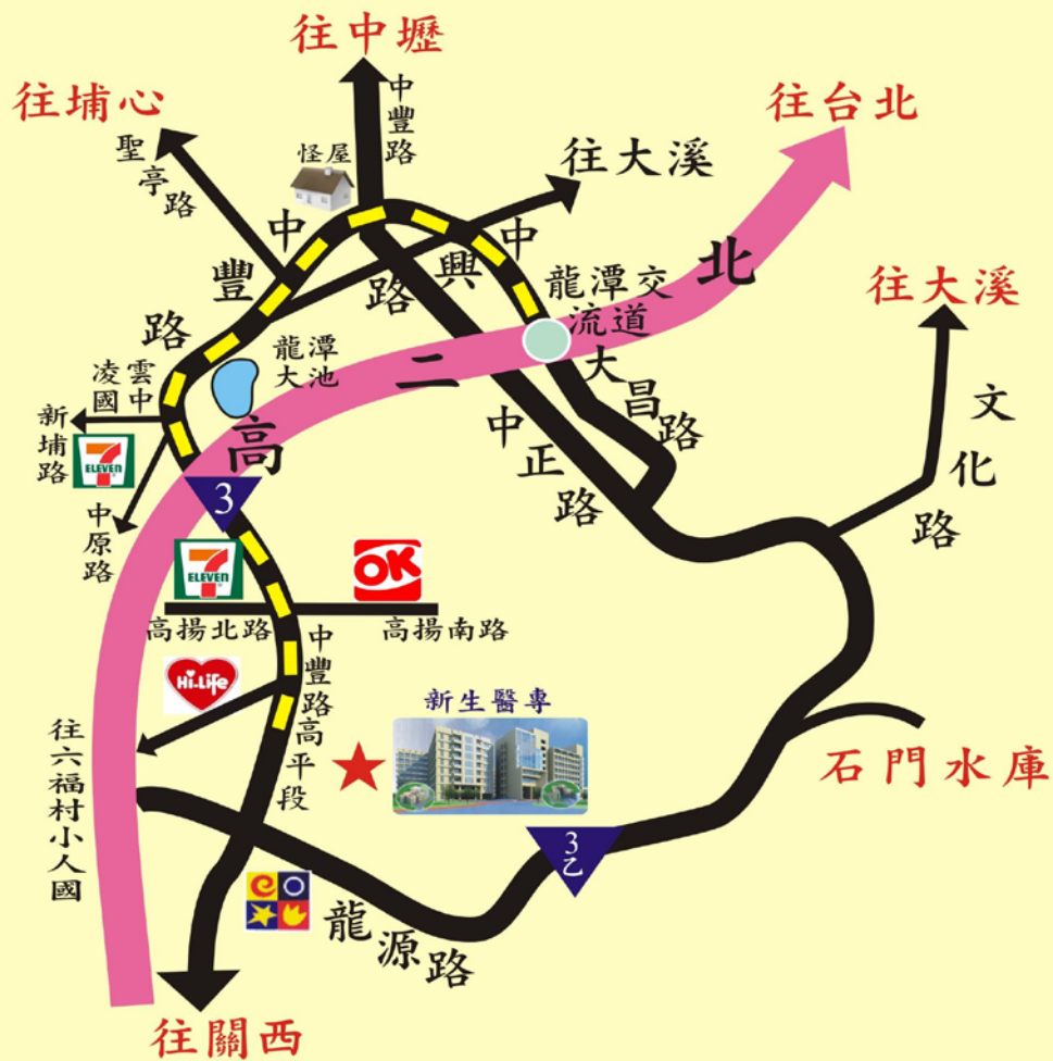
新生醫護管理專科學校新校區位置圖 325桃園縣龍潭鄉中豐路高平段418號