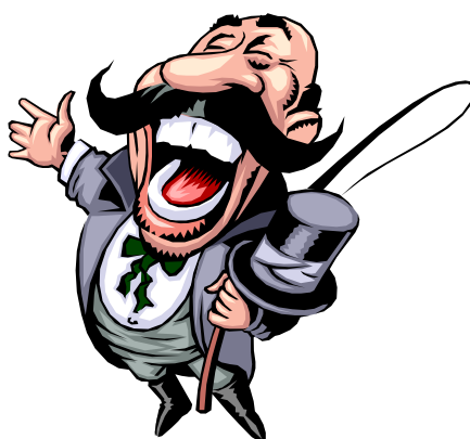
圖 1.1 圖片的格式 資料來源：本研究